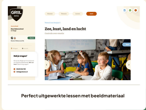
Perfect uitgewerkte lessen met beeldmateriaal